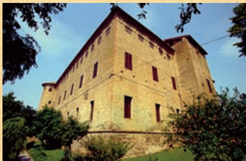
Castello di San Pietro in Cerro

nel quale vengono messe a confronto le architetture di una fortificazione per scopi militari del XIV secolo e quelle di una fortificazione residenziale del XV secolo.